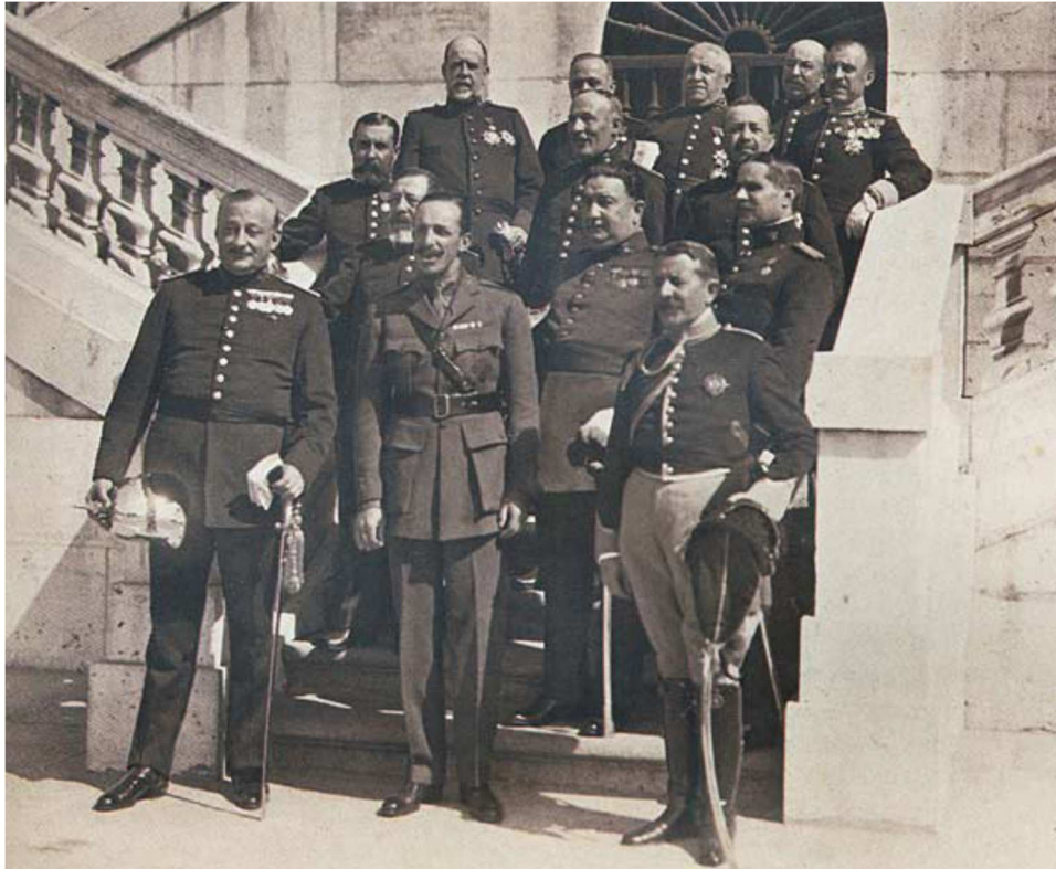
Alfonso XIII y Primo de Rivera con los ministros del Directorio Militar

* A partir de sus conocimientos y del material adjunto desarrolle el tema: El reinado de Alfonso XIII: la crisis de la Restauración (1902-1931) (Intentos de modernización. Regeneracionismo y revisionismo / La quiebra del sistema: conflictividad social y crisis de 1909, 1917 y 1921 / La Dictadura de Primo de Rivera). Valoración máxima: 6 puntos.