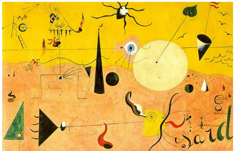
Lámina 2: Joan Miró. El cazador . 1923-1924. Óleo sobre lienzo. 66 x 100 cm. The Museum of Modern Art, Nueva York.