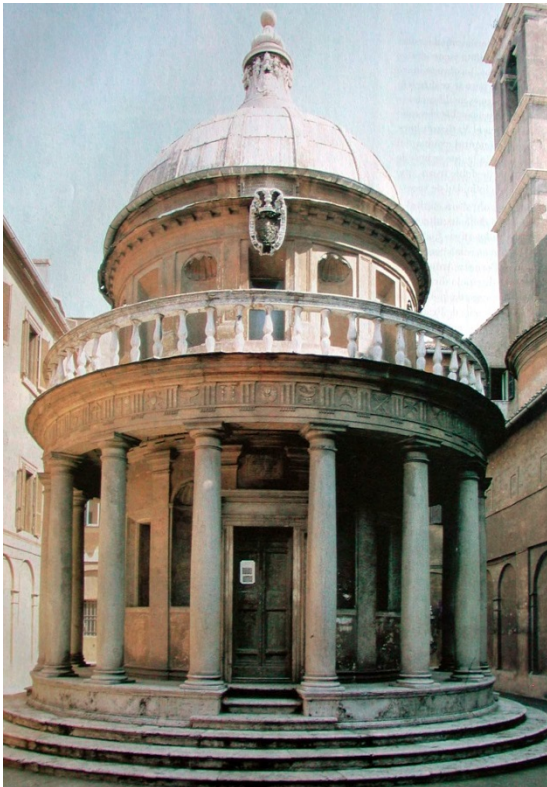
Lámina 3: Donato Bramante. Temples de San Pietro in Montorio (Roma). 1502.