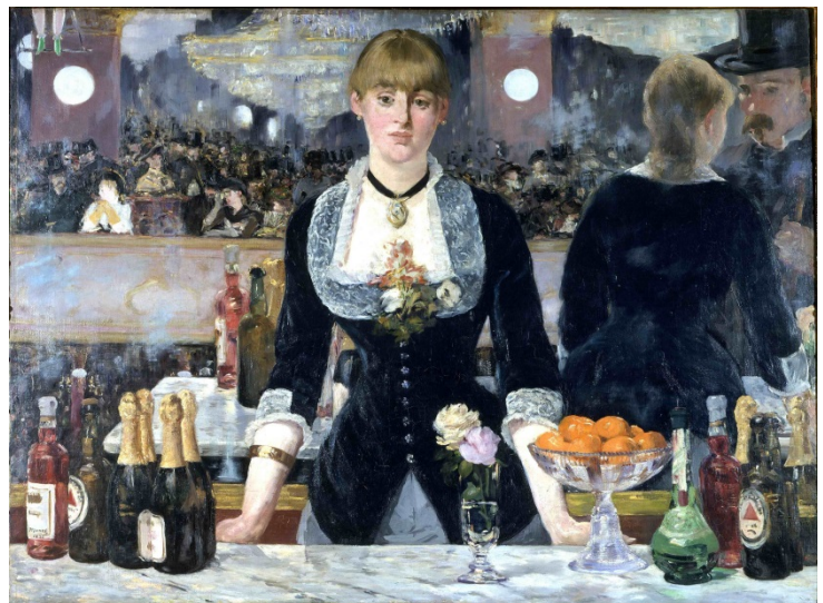
Lámina 4: Edouard Manet. Un bar en el Follies-Bergère . 1881-1882. Óleo sobre lienzo. 95 x 129 cm. The Courtauld Collection, Londres.